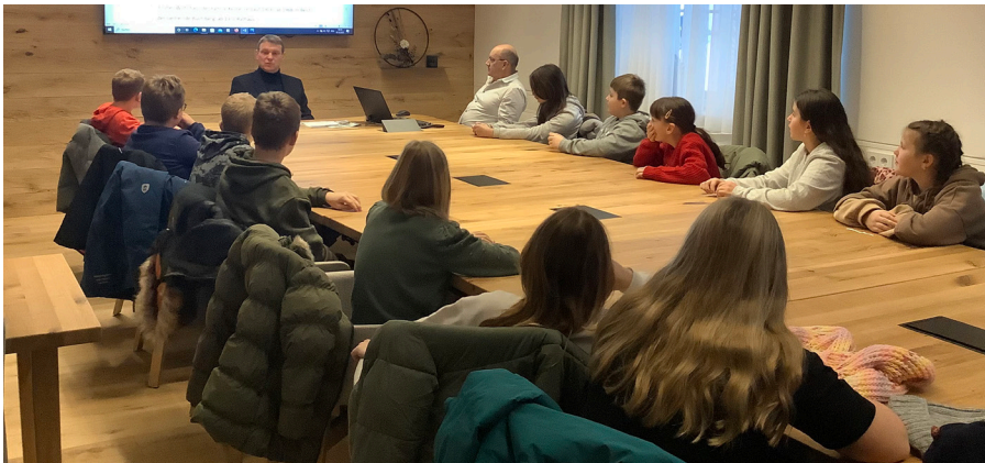
Fragestunde im Sitzungssaal.