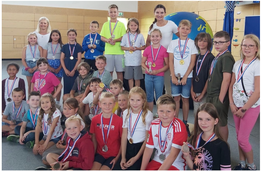
Bei den Bundesjugendspielen erreichten 20 eine Ehrenurkunde und 47 eine Siegerurkunde.

Kurz vor Ende des Schuljahres konnten sich die Verantwortlichen freuen, die Grundschule wurde Sportgrundschule. Das hat sie in erster Linie den sportlichen Aktivitäten, aber auch den Erfolgen zu verdanken. Die Palette ist hier breit, so dass nur ein Ausschnitt genannt werden soll. Bei den Niederbayerischen Schulschachmeisterschaften in Dingolfing stellten sich unter fast 250 Kindern auch vier Büchlberger der Konkurrenz, Ergebnis war ein sehr guter vierter Platz. Bei den Schulmeisterschaften im Kleinfeldtennis duellierten sich 15 Teams aus Stadt und Landkreis. Die Büchlberger schafften es bis ins Finale mit der Grundschule Eging am See, das sie am Ende gewannen. Beim Mannschaftswettbewerb im Schwimmen nahmen im Büchlberger Freibad 10 Mannschaften aus acht Schulen teil. Von den Einheimischen wurden vier Schülerinnen und vier Schüler ins Rennen geschickt, am Ende wurden diese Acht gute Vierte. Neben den Büchlbergern nahmen noch 11 Mannschaften am Kreisfinale der Grundschulen teil. Nach einem Siebenmeterschießen standen die Büchlberger im Finale, das sie allerdings verloren. Erfolgreich wurde es dann auch beim Leichtathletiksportfest, an