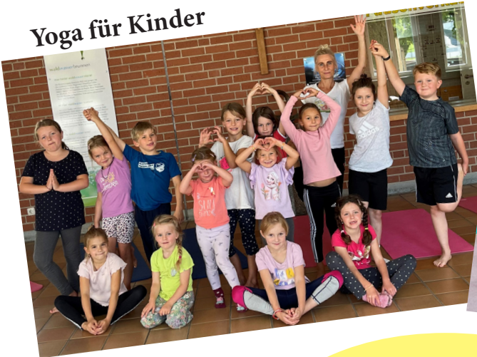
Yoga für Kinder