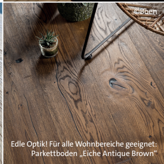
Edle Optik! Für alle Wohnbereiche geeignet: Parkettboden „Eiche Antique Brown“

Beinbauer Holz GmbH | Obermühle 3 | 94124 Büchlberg Tel. 0 85 05 - 9114-0 | www.beinbauerholz.de | Folgt uns auf: