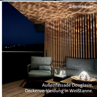
©Beinbauer Außenfassade Douglasie, Deckenverkleidung in Weißtanne.