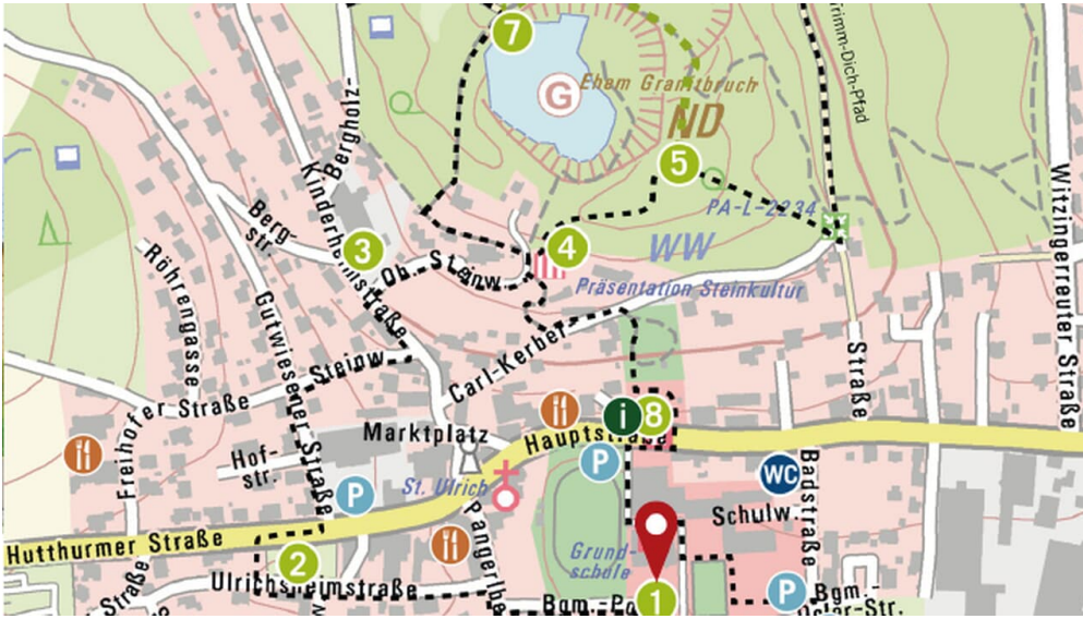
Weg mit Legende