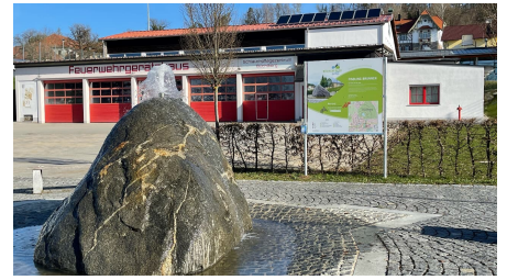
Station 1_Brunnen am Feuerwehrhaus