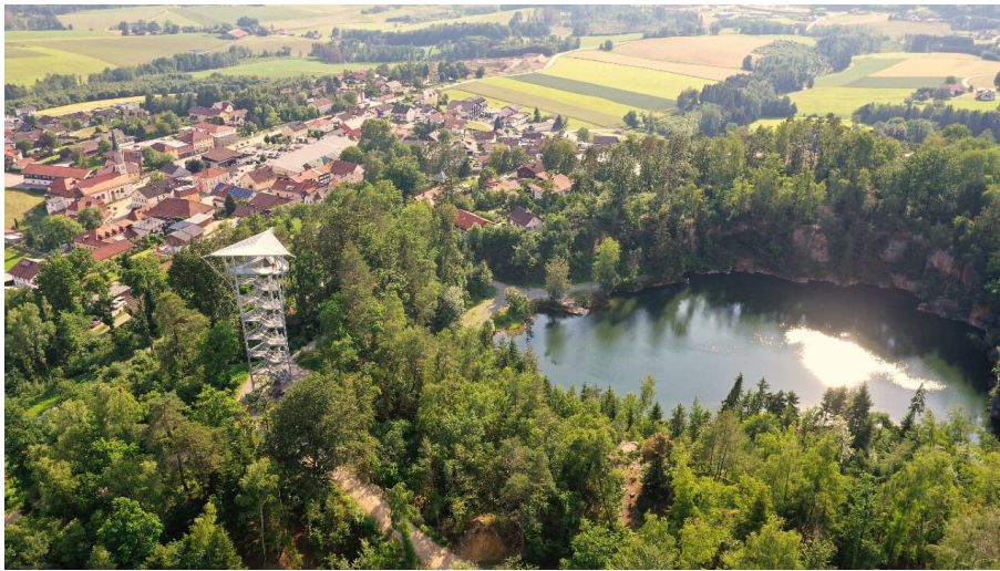
Bergholz mit Aussichtsturm