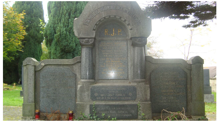
Station 2 Alter Friedhof