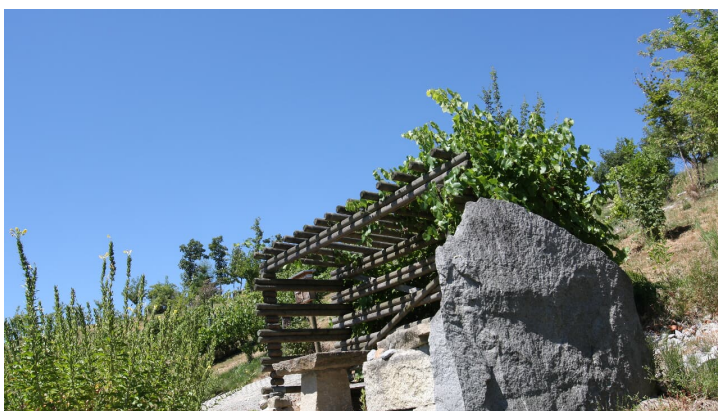
Naturfriedhof am Weinberg