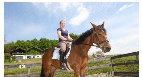
pferdekoppel-sommerberg - © Gemeinde Büchlberg